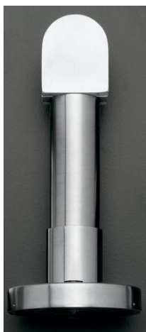
Dolná nerezová noha