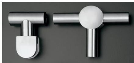
Stužujúce prvky nerezovej hrazdy