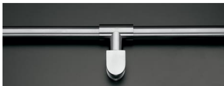
Horná nerezová stužujúca hrazda