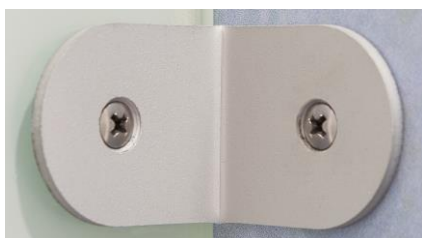
Boční hliníkový profil