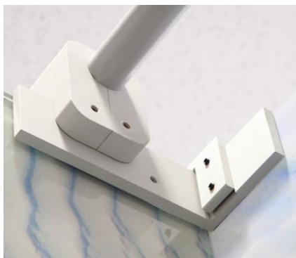
Horní hliníková hrazda