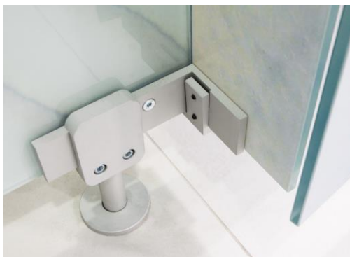
Dolní středová hliníková noha